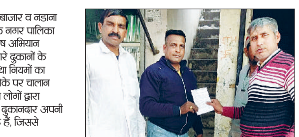
तरावड़ी। नगरपालिका टीम अतिक्रमण करने वाले दुकानदारों के चालान करते हुए।