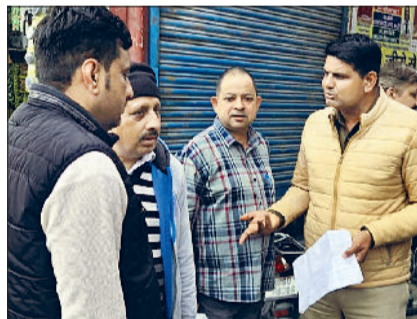
समालखा। जनता के नशे के विरुद्ध जागरूक करते हुए पुलिस टीम।

पानीपत पुलिस जिले को नशा मुक्त बनाने की दिशा में जागरूकता अभियान चलाए हुए है। इसी कड़ी में जिला पुलिस की नशा मुक्त टीम ने बुधवार को समालखा में वार्ड नंबर 8, 9 व 15 में डोर टू डोर जाकर लोगों को नशे के दुष्प्रभावों बारे बताकर नशे के खिलाफ जागरूक किया। पुलिस टीम ने गांव में घर-घर जाकर लोगों को बताया कि नशा न केवल व्यक्ति के स्वास्थ्य को नुकसान पहुंचाता है, बल्कि पूरे परिवार और समाज पर भी इसका गंभीर प्रभाव पड़ता है। लोगों को बताया गया कि नशे की लत कैसे धीरे-धीरे व्यक्ति को अपने जाल में फंसा लेती है और समय रहते इससे बचाव कितना आवश्यक है। अभिभावकों