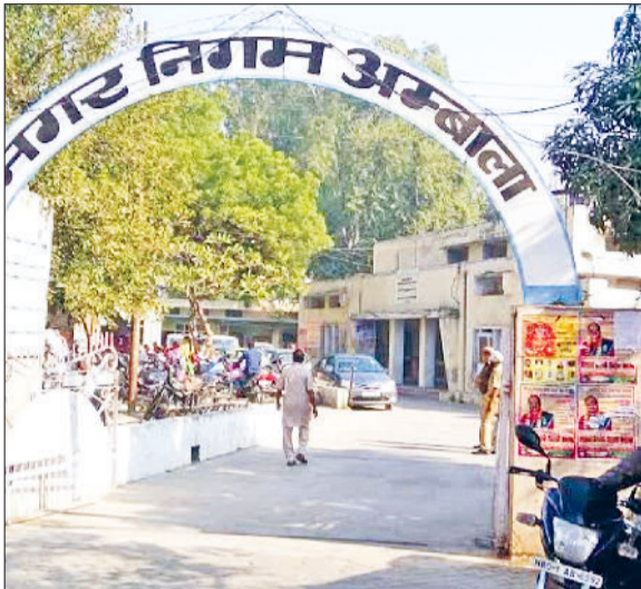
अंबाला। नगर निगम कार्यालय का बाहरी दृश्य।