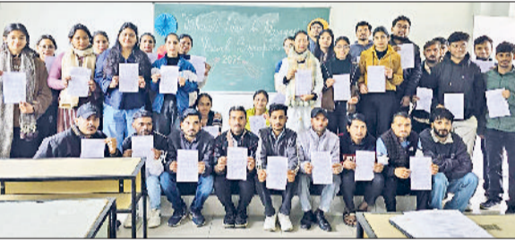
बराड़ा। कार्यक्रम में भाग लेते हुए प्रतिभागी।

लॉर्ड कृष्णा कॉलेज ऑफ एजुकेशन अधोया में यूजीसी के निर्देशानुसार "भारती-नारी से नारायणी" विषय पर प्रेरणादायक एवं विचारोत्तेजक शैक्षणिक कार्यक्रम का आयोजन किया। कार्यक्रम के अंतर्गत छात्रों द्वारा महान भारतीय महिलाओं की विजुअल बायोग्राफी प्रस्तुत की तथा तत्पश्चात प्रभावशाली पैनल चर्चा आयोजित की। कार्यक्रम के प्रथम चरण में डीएलएड एवं अन्य कक्षाओं के विद्यार्थियों ने विभिन्न प्रेरणास्रोत महिलाओं के जीवन, संघर्ष, उपलब्धियों एवं समाज के प्रति उनके योगदान को प्रभावशाली