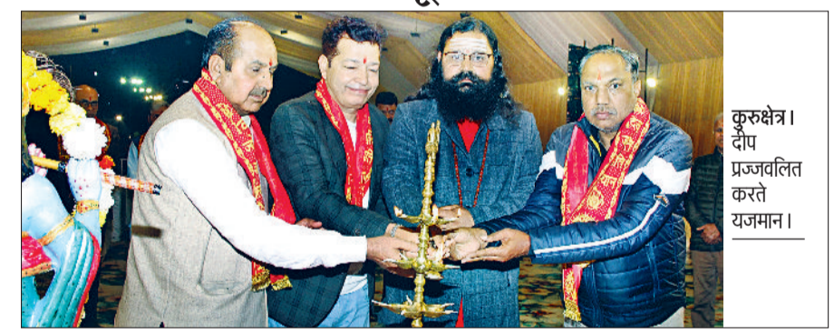
कुरुक्षेत्र। दीप प्रज्वलित करते राजमान।

जा रहा है। उसको धार्मिक भावों के संस्कार उनके पिता से प्राप्त हुए थे। साध्वी ने बताया कि माता-पिता बच्चों के पहले मार्गदर्शक होते हैं। जिस तरह से एक माली पौधों को सौंचता है, माता-पिता उसी तरह अपने बच्चों को जीवन के मूल्य और आदर्शों से पोषित करते हैं। परंतु विडम्बना की बात है कि आज के समय में जब माता-पिता अपनी व्यस्त दिनचर्या और भौतिक आकांक्षाओं के कारण बच्चों को संस्कार नहीं दे रहे उसके दुष्परिणाम बच्चों के व्यक्तित्व पर पड़ रहा है। जैसे बच्चों के सम्मान में कमी, अंधकार, अपनी बात मनवाने के लिए ज़िद और अनियंत्रित क्रोध का सहारा लेना। आज माता-पिता का बच्चों उचित समय न देने के कारण स्क्रीन एडिक्शन के शिकार हो रहे हैं। अपना समय मोबाइल, इंटरनेट, को सोशल-मीडिया पर बिताते हैं। संस्कारों की कमी के कारण वे भटक हुए युवा बन सकते हैं जो समाज की संपत्ति के बजाय समस्या बन रहे हैं। साध्वी ने बताया कि आज सभी को अध्यात्म की आवश्यकता है।