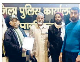
पानीपत। पुलिस कप्तान ऑफिस में मांस विक्रेताओं के खिलाफ शिकायत लेकर पहुंचे पीड़ित।