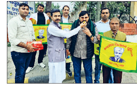
एक-दूसरे को मुंह मीठा कराते हुए।