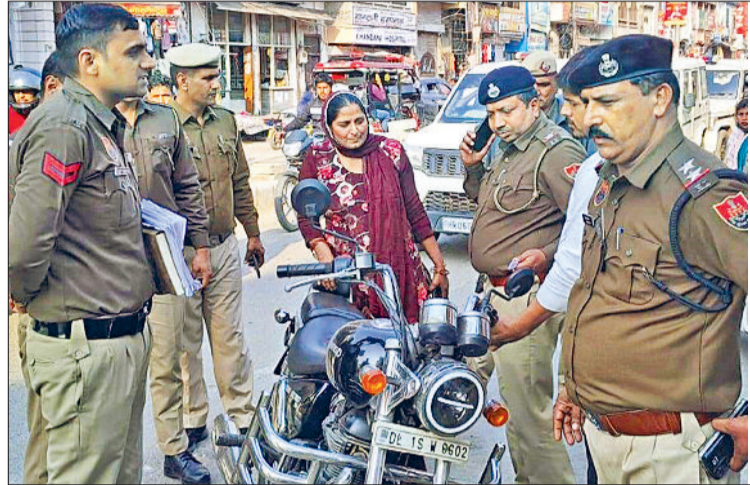
प्रशासनिक स्तर पर कोई स्थायी समाधान नहीं हो रहा

2 अतिक्रमण पर कड़ाई बरतने और स्थायी व्यवस्था की जाने की मांग की